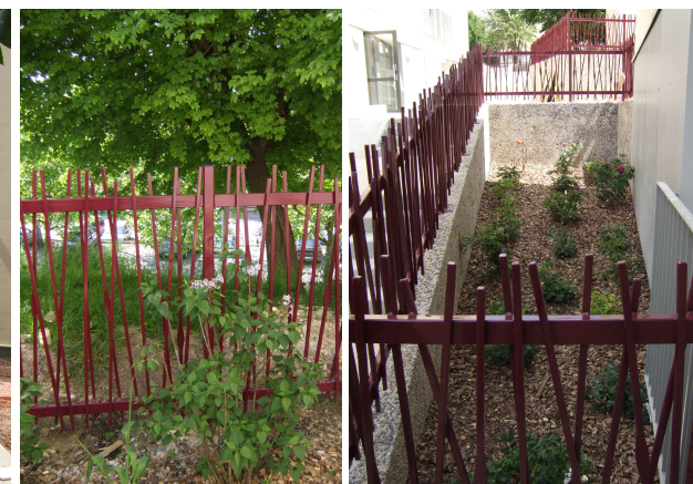
Serrurerie spécifique : fer plein avec motif forgé d'une feuille de laurier