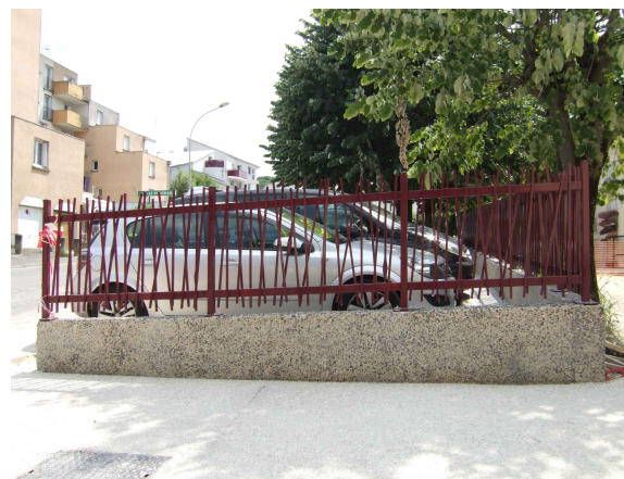
Maçonnerie spécifique : désactivation verticale, avec béton constitué de mignonette 0/9 et de porphyre noir 20/40